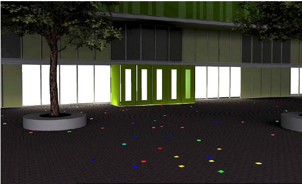
Schetsimpresie van de vierkante lichtvlakken op het plein (afbeelding uit het schetsontwerp)

Voor 'Confetti' werd Kluiters aangetrokken door de architectuur en activiteiten van de enorme, voor de buitenwereld hermetisch afgesloten sportzalen in het nieuwe sportcentrum 'Arcus'. Van alle dagelijkse bedrijvigheid in de zalen is buiten helemaal niets te zien of te merken.