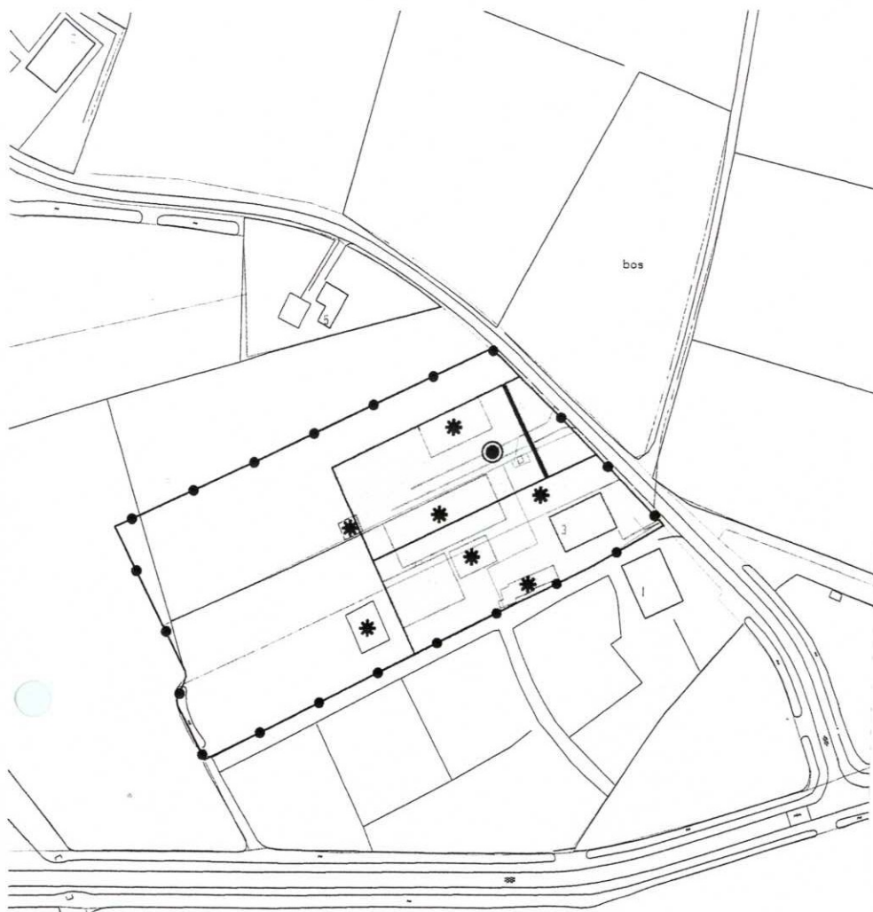
BESTEMMINGSPLAN BUITENGEBIED PARTIELE HERZIENING SLUISSTRAAT 3 HERNEN SCHAAL 1:2000